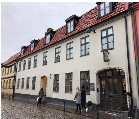
Östra Mårtensgatan 5, Lund, 2018