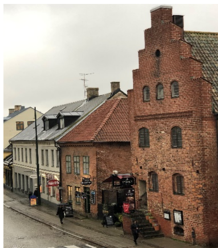
Stäket, Lund, 2020

Fastigheten från 1700-talet finns fortfarande kvar och är numera Nordic Hotel, bara ett par hundra meter från Stora Södergatan 7 som har varit mitt hem sedan 1986. Tvärs över Stora Södergatan finns den kända fastigheten Stäket från 1570-talet, Lunds äldsta ännu kvarvarande bostadshus.