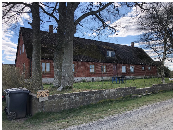
Hårderupsgården, april 2020