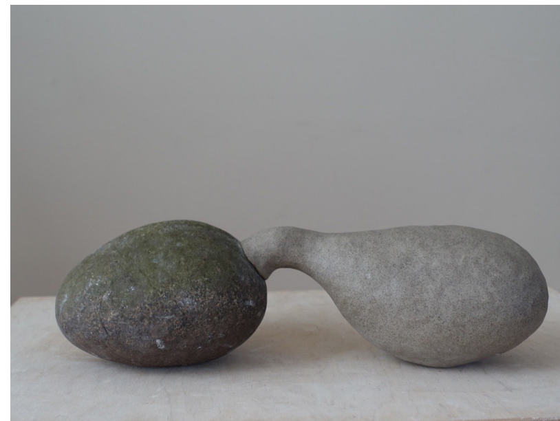
Smaken av sten, skulptur av Annika Svenbro